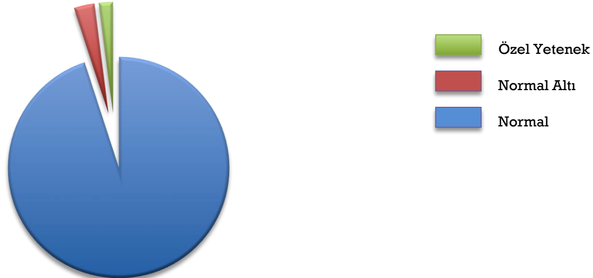
TOPLUMU OLUŞTURAN BİREYLER

% 2'sinin yetenekli olduğu kabul edilmektedir.